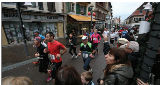
■ Les sportifs arpentent le bitume.