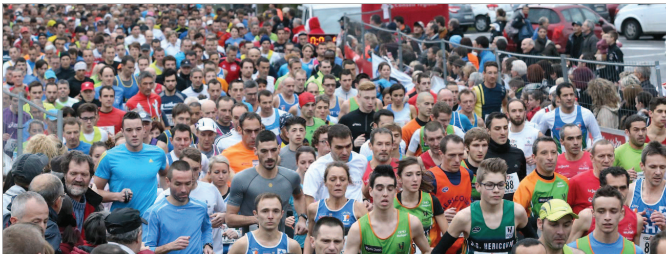
■ La marée humaine, au départ de la course des As, a déferlé dimanche sur la ville d'Héricourt.