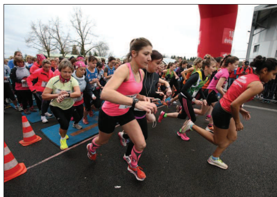
■ Les filles de « Elles y courent » ont fait le succès du premier 5 km héricourtois.

Retrouvez les résultats en page Sport et sur estrepubicain.fr