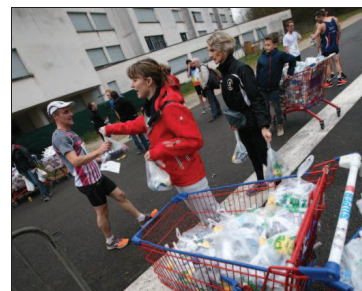
■ Après l'effort...

Le coin des enfants Les 70 coureurs de l'école de Saulnot